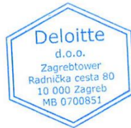
Domagoj Vuković Ovlašteni revizor